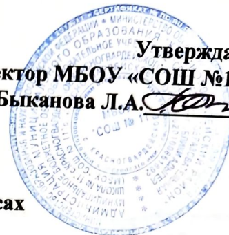
График оценочных процедур в 1–11-х классах на 2022/23 учебный год Первое полугодие